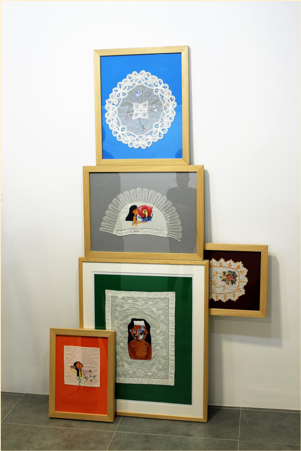
DETALLE DE LA EXPOSICIÓN I