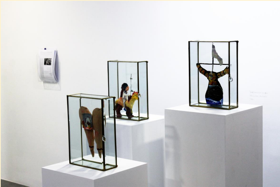
DETALLE DE LA EXPOSICIÓN II