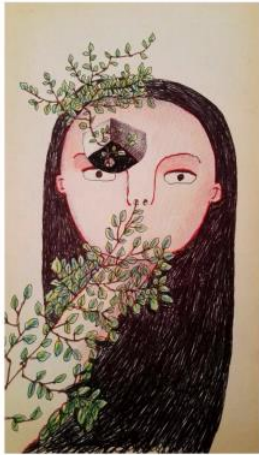
DETALLE DE LA EXPOSICIÓN III