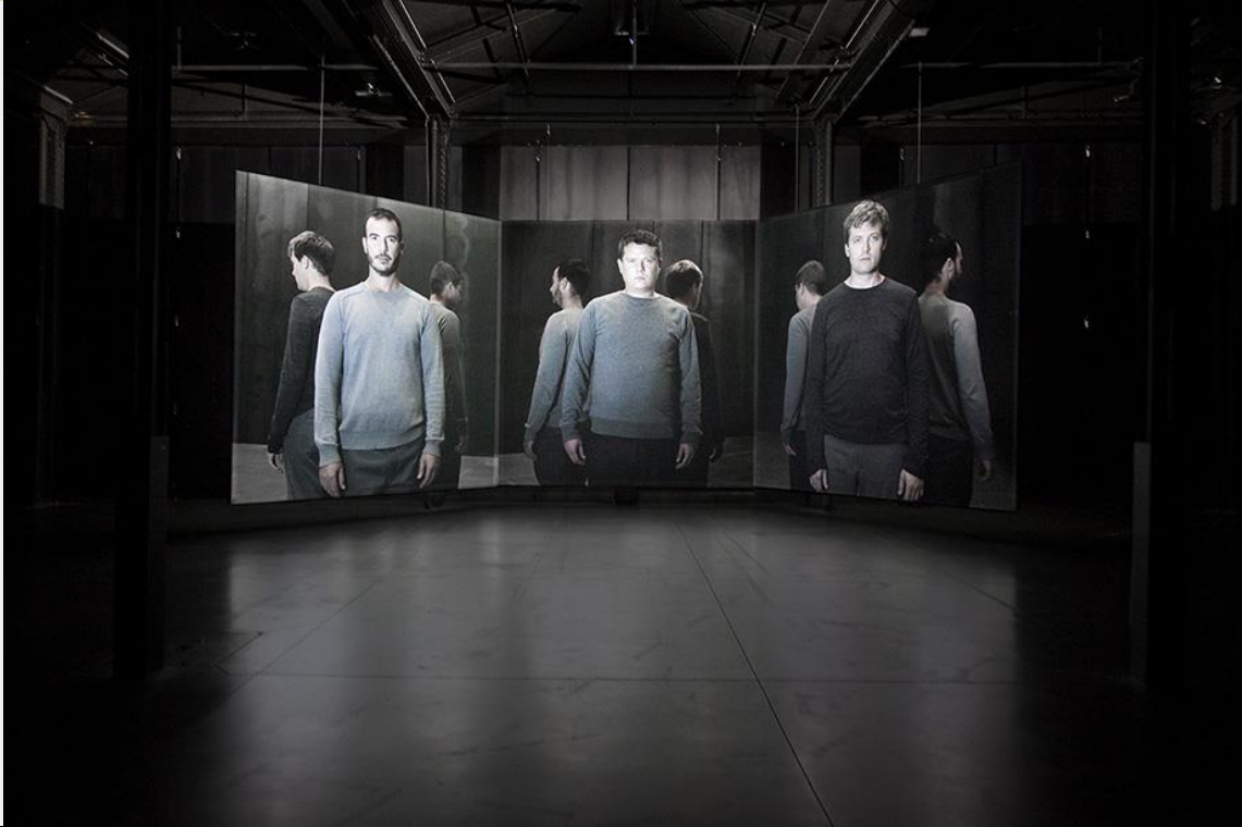
Maya Watanabe. "El Péndulo". Video instalación de tres canales. Vista de instalación, Matadero Madrid, 2014.